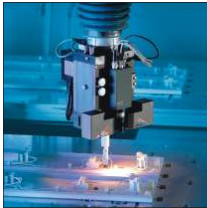
Automaattisen johdotuksen ALF-järjestelmät

Tämä VS-tuoteryhmä sisältää muuntajat sekä halogeenilamppu- ja yleiskäyttöisten hehkulamppuvälisinten kannat. Lampunkannat valmistetaan muovista, metallista, posliinista tai kuumuutta kestävästä muovista.